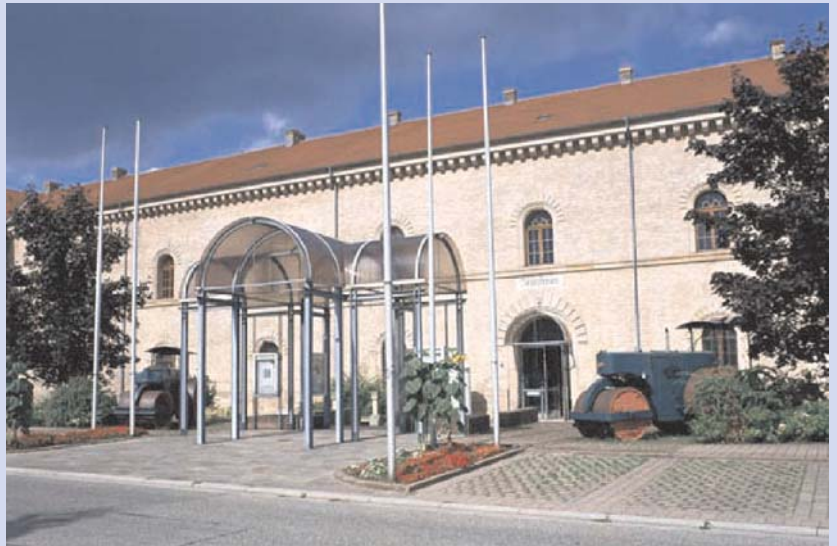
Deutsches Straßenmuseum, Germersheim

Mitgliederversammlung mit Wahl des Vorstandes im Deutschen Straßenmuseum in Germersheim Freitag, 8. Oktober 2021